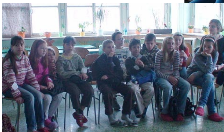
Deti počúvali úplne bez dychu a otázkam nebolo konca—kraja.