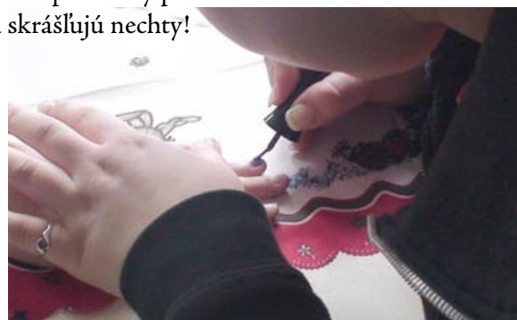
Vizážistky mali plné ruky práce. Práve sa skrášľujú nechty!