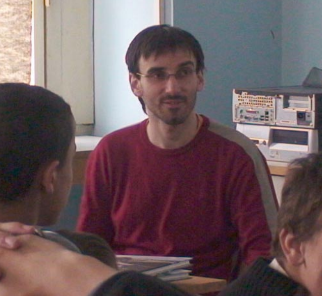
Rozprávanie cestovateľa po Južnej Amerike bolo pútavé.