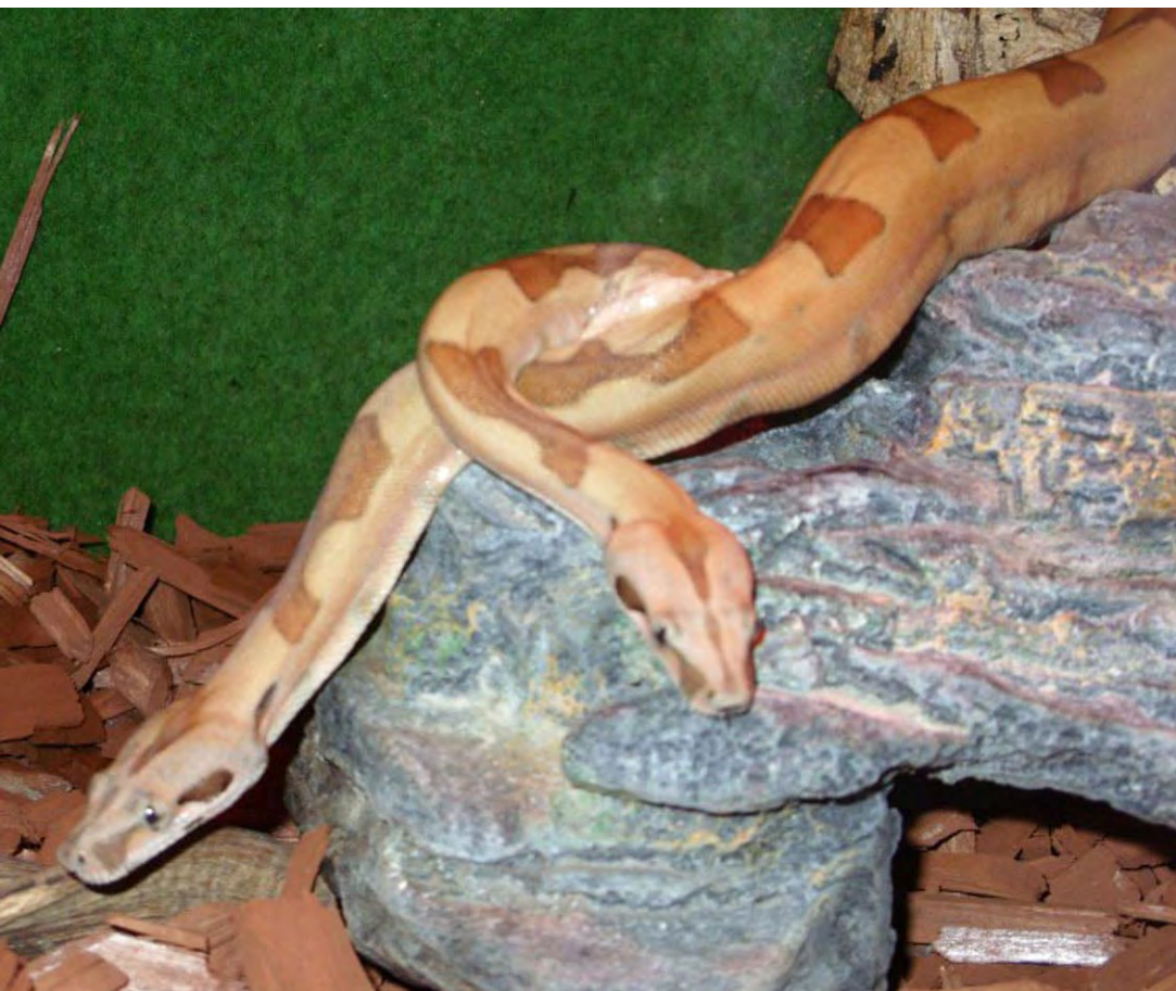
Dvojhlavý kráľ hadov - anakonda

19. 2. sa v rámci podobných aktivít školského klubu detí uskutočnil priam fascinujúci výlet na výstavu plazov. Deti boli nadšené! S veľkým očakávaním túžili vidieť dvojhlavého kráľa hadov - anakonda a okrem nej videli veľa zaujímavých hadov, jašterov, pavúkov, obojživelníkov... K nemalej skupinke detí sa pridali aj bývalí žiaci našej školy, ktorí sa k nám radi vracajú a zapájajú sa ešte aj teraz do školských a aj mimoškolských aktivít. Častokrát sú pre nás veľkou pomocou - keď robia „strážnych anjelov“ našim žiakom a pomáhajú s organizáciou.