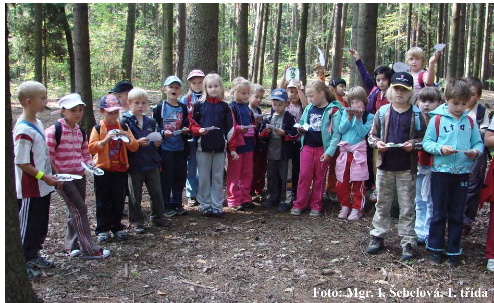
1. třída

Na 1. stupni probíhaly projektové dny postupně ve třídách již od září 2009.